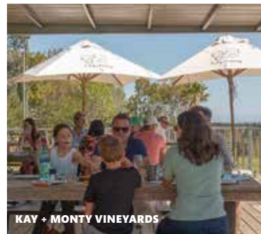
KAY + MONTY VINEYARDS

Bezoek in ieder geval Lodestone Wine & Olives, lodestonewines.co.za en Kay + Monty Vineyards, www.kayandmonty.com