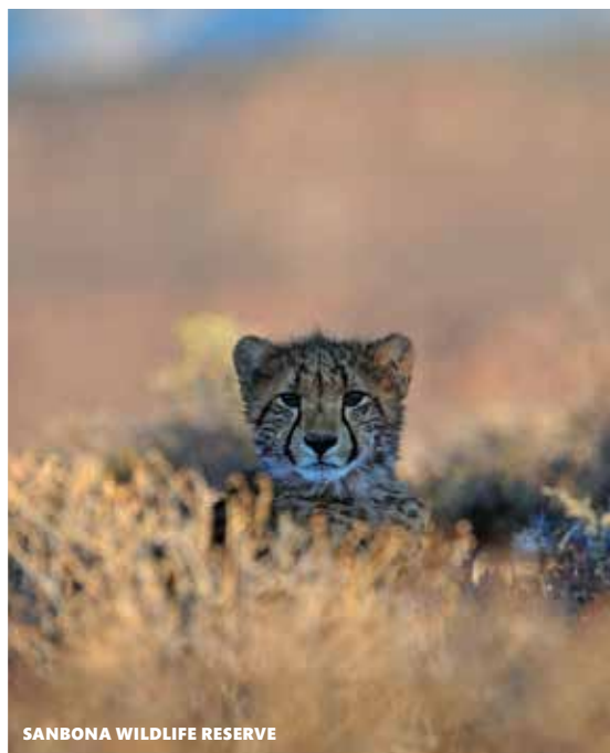
SANBONA WILDLIFE RESERVE