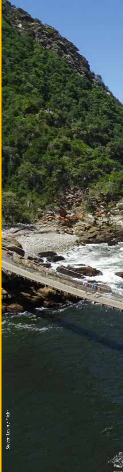
Steven Levin / Flickr