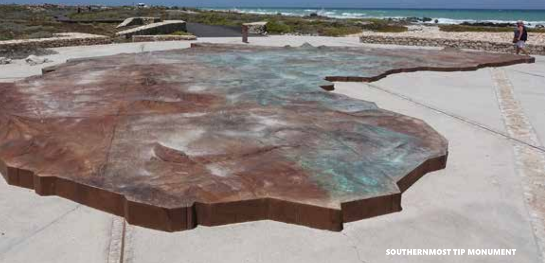
SOUTHERNMOST TIP MONUMENT