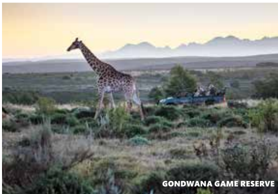
GONDWANA GAME RESERVE