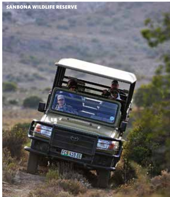
SANBONA WILDLIFE RESERVE