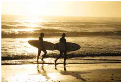
DONKIN HERITAGE TRAIL