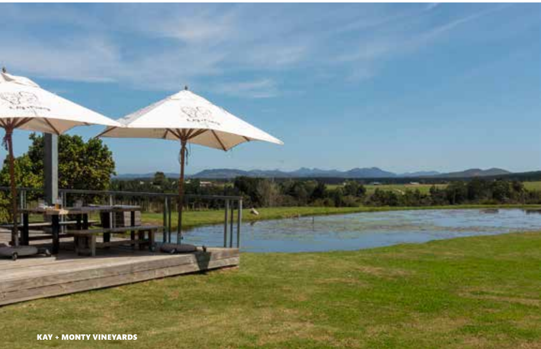
KAY + MONTY VINEYARDS