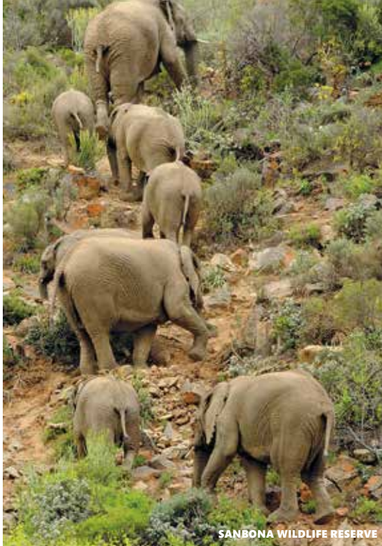
SANBONA WILDLIFE RESERVE